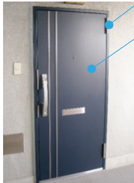
ある永谷マンションの 対震ドア交換例

大きな地震で枠が変形しても小さな力で ドアの開閉が可能(特殊な丁番)などが 最大の利点