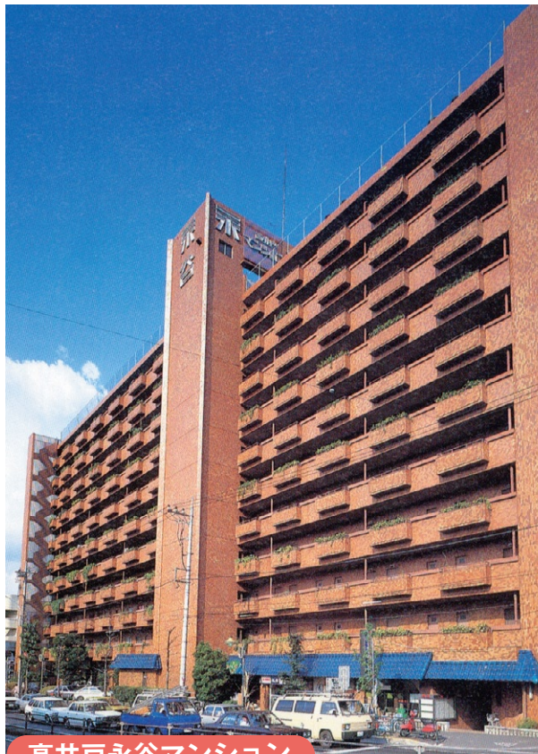
高井戸永谷マンション

ピロティ構造の問題を抱える管理組合では耐震問題の対応へ日々取り組んでいます。「高井戸永谷マンション」では耐震改善工事として①の柱と柱の間に壁を作る補強工事が行われています。工期は平成26年9月から12月にかけての約3か月間。尚、耐震壁新設の他にも各階の柱と壁の間にスリット(切れ目)を入れ、柱の変形性能を向上させる耐震補強工事も併せて行われています。