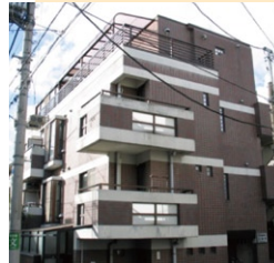
フォレスト方南町

永谷建物管理株式会社は、45年の実績と 豊富な経験で信頼を頂いております。 まずはお気軽にご相談ください。