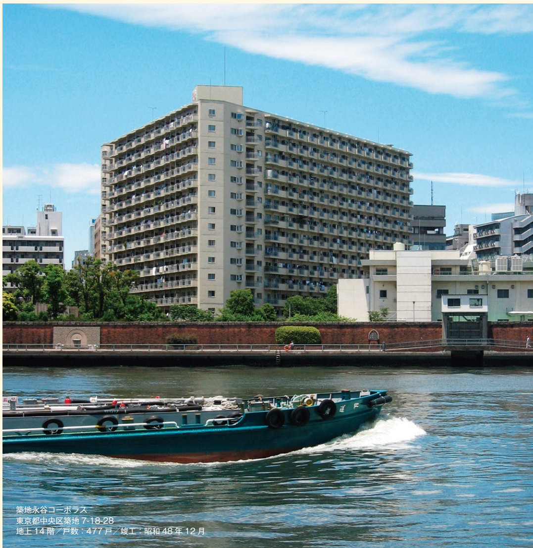
築地永谷コーポラス 東京都中央区築地 7-18-28 地上14階/戸数：477戸/竣工：昭和48年12月