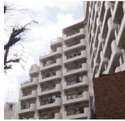
永谷ビルプラザ六本木 総戸数133戸11階建 昭和47年竣工当時、先取り的なワンルームマンションとして話題になる