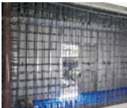
耐震壁内部の配筋行程

東京都杉並区高井戸東 2-29-23 地上11階/戸数:130戸/竣工:昭和49年3月