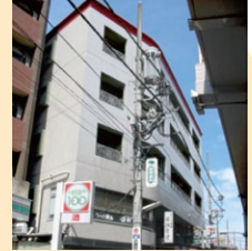
吉祥寺モトハシビル