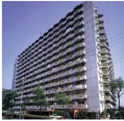
築地永谷コーポラス 総戸数477戸14階建 昭和49年竣工当時、戸数が日本一