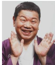
昔昔亭桃太郎 1965年6月 春風亭柳昇に入門 昇太となる 1969年4月 二ツ目昇進、 春風亭笑橋となる 1980年10月 真打昇進 昔昔亭桃太郎となる 日本一の爆笑王

15:20 15:00 14:50 14:25 14:05 13:45 13:30