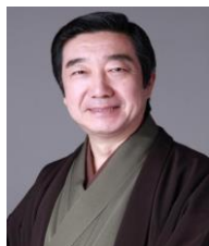
三遊亭風楽 昭和40年10月三遊亭円楽入門 昭和47年二ツ目昇進 昭和54年真打昇進松改め 初代三遊亭風楽襲名。 昭和52年第6回NHK新人落語 コンクール最優秀賞受賞 昭和53年日刊飛切り 落語会若手落語家奨励賞受賞 平成5年文化庁芸術祭賞受賞

15:20 15:00 14:50 14:25 14:05 13:45 13:30