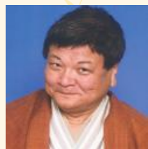
桂竹丸 (5日夜・20日夜・22日昼)