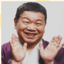
昔昔亭桃太郎 (5日夜・26日夜)